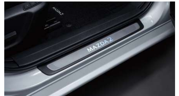
PISA ALFOMBRA ILUMINADO